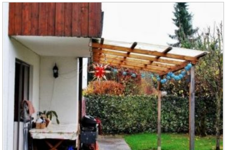
Garten - Terrasse - Balkon