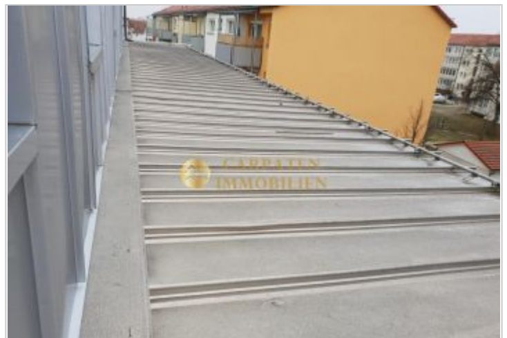
Dach 2. Stock